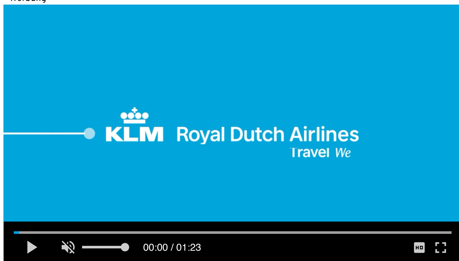
Video - Nutze die Stärke der Vielfalt - KLM Royal Dutch Airlines

LGBTI Liberals of Europe ist der Zusammenschluss von 15 liberalen Mitgliedsorganisationen aus Deutschland, Frankreich, Großbritannien, Italien, Lettland, Litauen, den Niederlanden, Norwegen, Österreich, Schweden, Spanien, der Ukraine und Ungarn. (cw/pm)